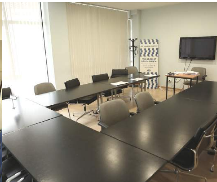
Sala de Formação em U