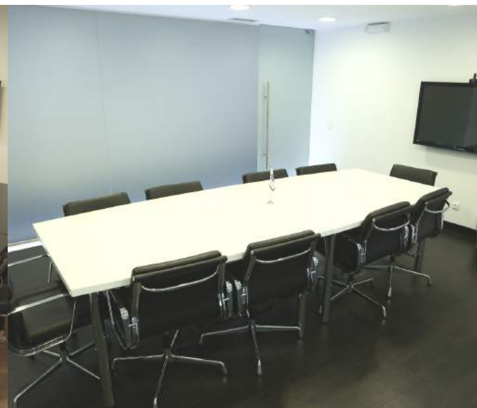
Sala de Reuniões